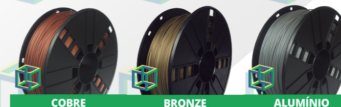
*imagens meramente ilustrativas; consulte a disponibilidade de cores.

Os filamentos metálicos são feitos de uma mistura de plástico PLA e 25% - 30% de metal em pó. Apresenta brilho e cintilação similar à do material em que se baseia (bronze, cobre ou alumínio), além de ser um material forte e resistente e de excelente aderência à mesa de impressão