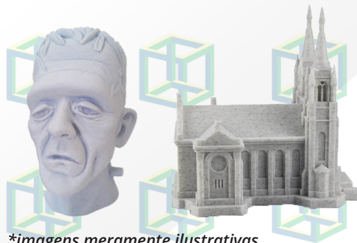
*imagens meramente ilustrativas

O filamento mármore, feito à base de PLA, é utilizado para construção de peças com aparência de mármore.